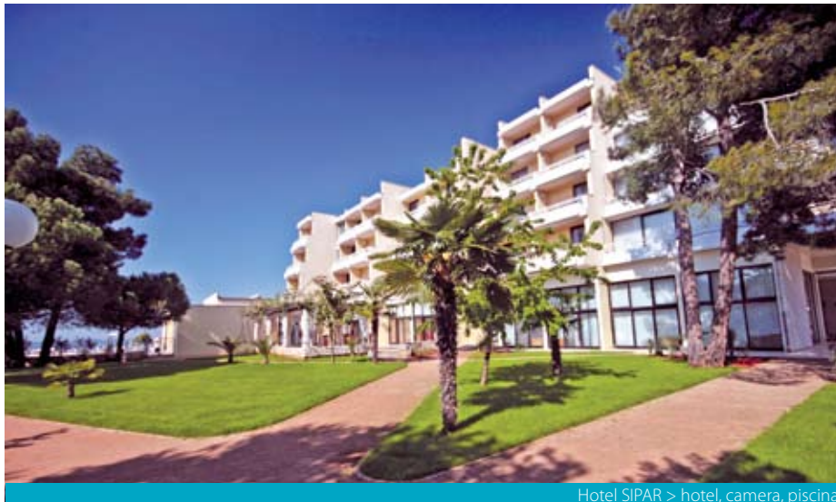
Hotel SIPAR > hotel, camera, piscina

Nota bene: spese di registrazione € 4 per persona da pagare in loco all'arrivo