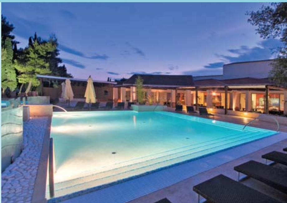
Hotel MELIA CORAL > hotel e piscina, jacuzzi, camera

Sistemazione presso gli hotel MELIA CORAL, SOL GARDEN ISTRA, SOL AURORA; villaggio di appartamenti SOL POLYNESIA.