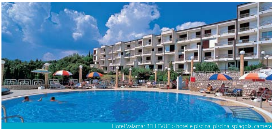
Hotel Valamar BELLEVUE > hotel e piscina, piscina, spiaggia, camera