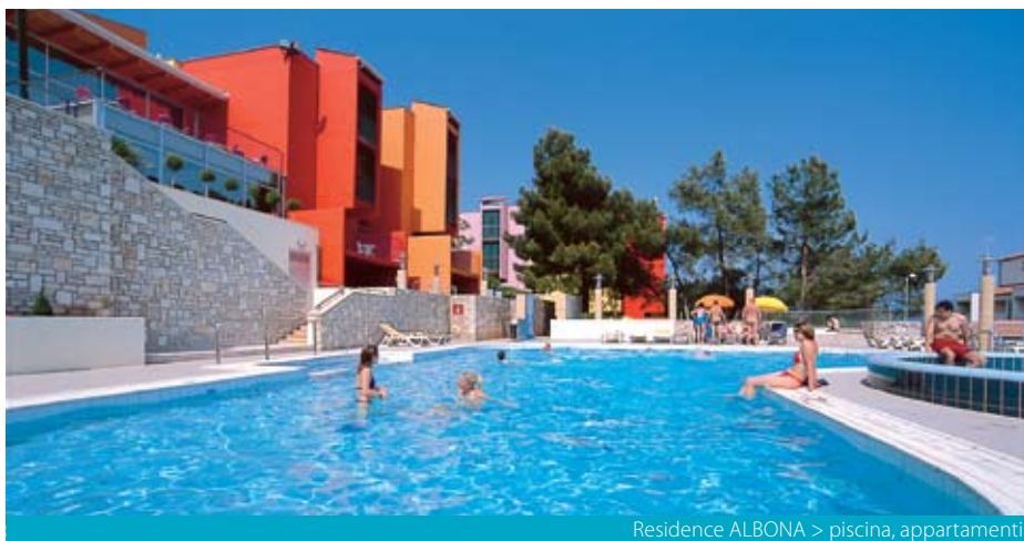
Residence ALBONA > piscina, appartamenti