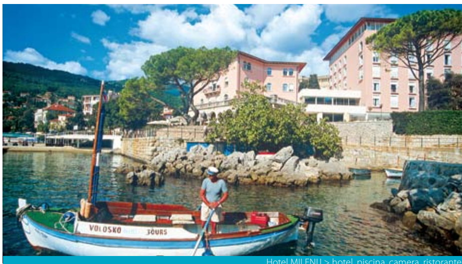
Hotel MILENIJ > hotel, piscina, camera, ristorante