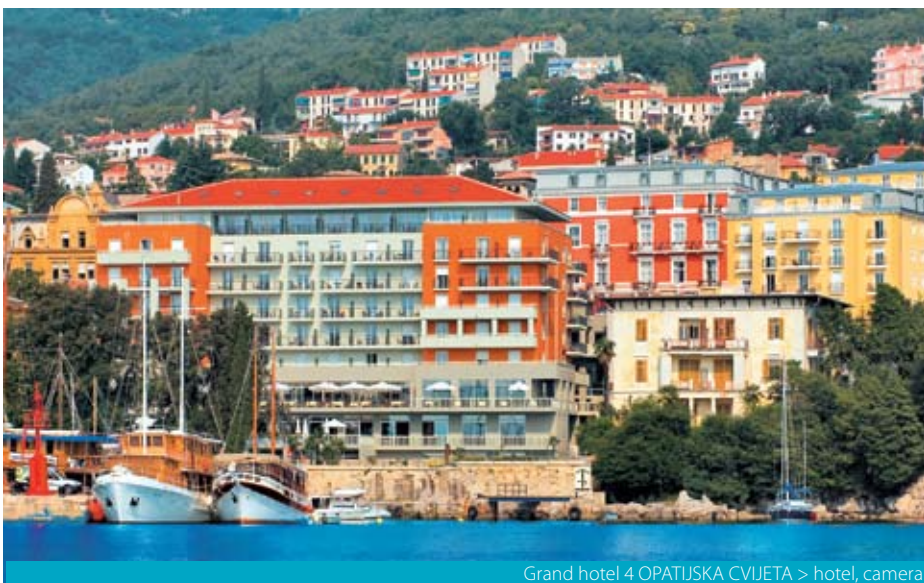
Grand hotel 4 OPATIJSKA CVIJETA > hotel, camera