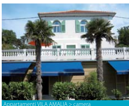
Appartamenti VILA AMALIA > camera