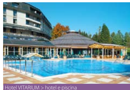
Hotel VITARIUM > hotel e piscina

terzo letto bambini fino a 11 anni GRATIS nel periodo 01.07.-31.08.