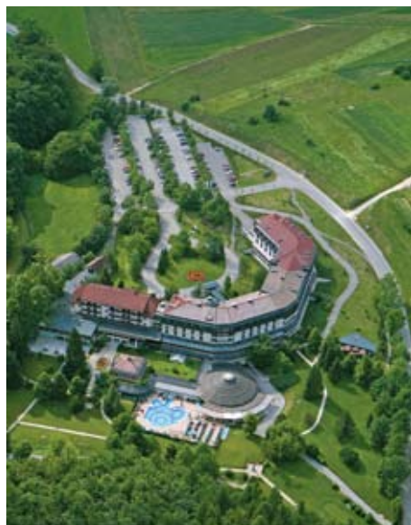
Hotel ŠMARJETA > hotel, camera

Queste terme sono consigliate per la cura delle malattie cardiovascolari, dei reumatismi e delle lesioni dell'apparato locomotorio, essendo ben dotate di attrezzature per la riabilitazione dentro il moderno centro medico..