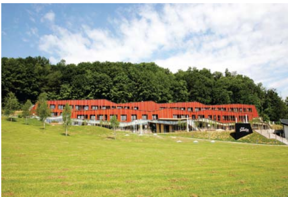
Wellness Hotel SOTELIA > camera, hotel

Nota bene: Natale e Capodanno quotazioni su richiesta