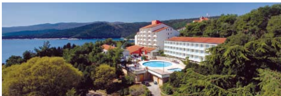
Hotel MIRAMAR > hotel e piscina, camera, ristorante