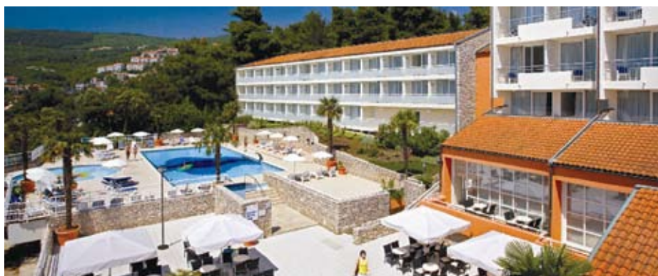
Hotel ALLEGRO > hotel e piscina, camera, ristorante