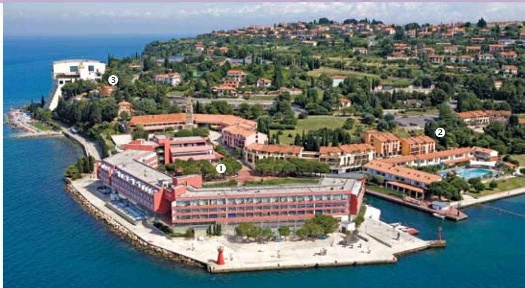
Complesso alberghiero BERNARDIN - 1 Hotel HISTRION, 2 Hotel VILE PARK, 3 Grand Hotel BERNARDIN