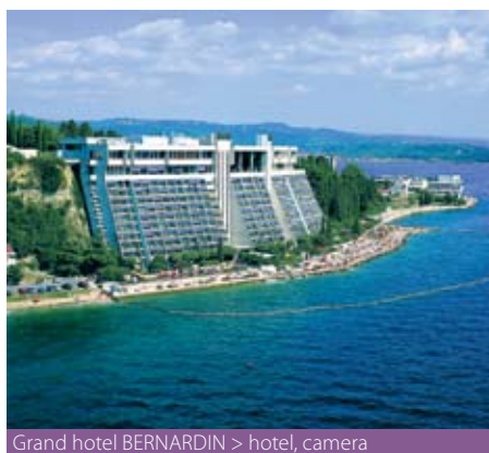
Grand hotel BERNARDIN > hotel, camera

Servizi inclusi: ingresso al complesso di piscine "Laguna Bernardin", ingresso alla spiaggia, ingresso al Casinò di Portorose.