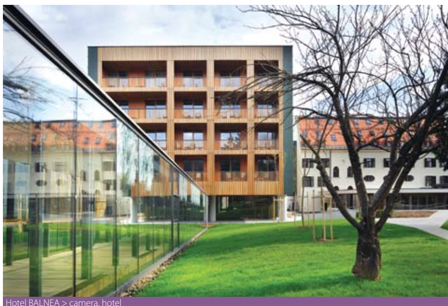
Hotel BALNEA > camera, hotel

Quote, supplementi e riduzioni per persona in €*tassa di soggiorno inclusa