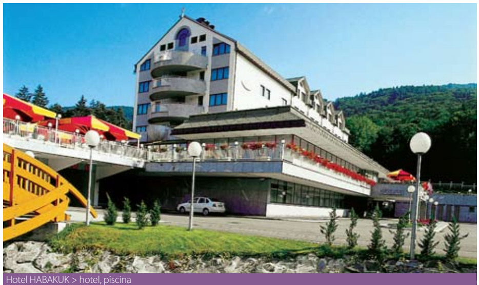
Hotel HABAUK > hotel, piscina