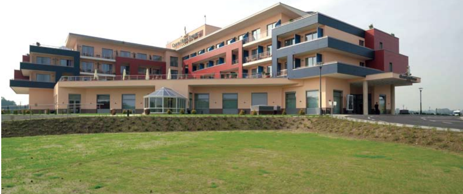
Grand Hotel PRIMUS > hotel, camera, piscina esterna e interna