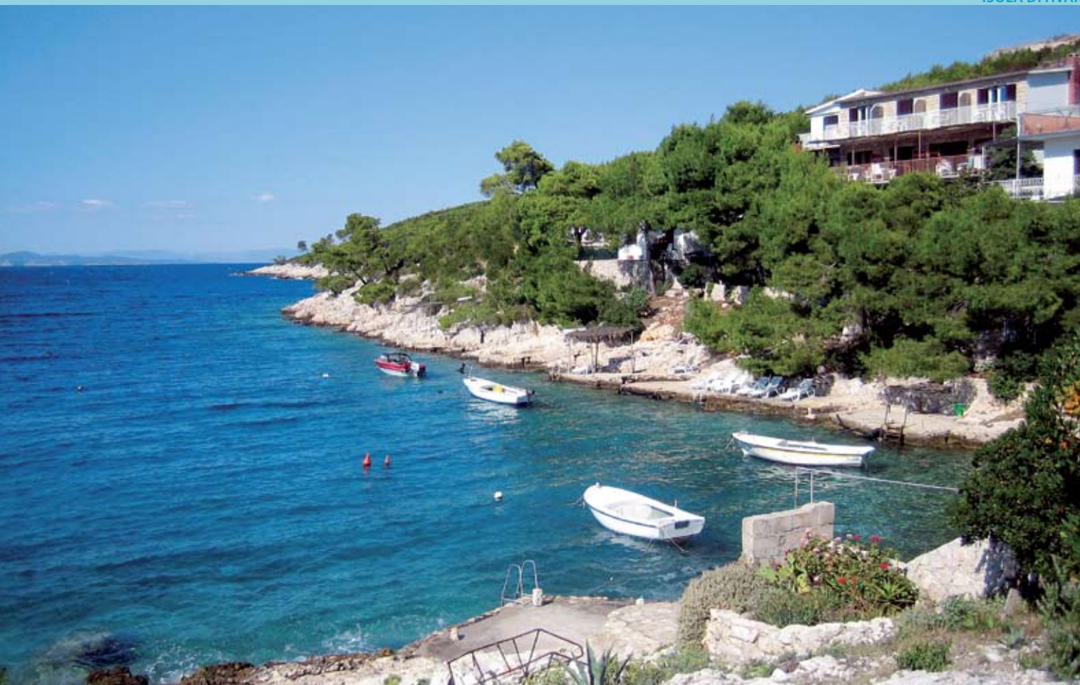
Appartamenti VILA PENZION JAGODNA &gt; penzion, spiaggia, camera