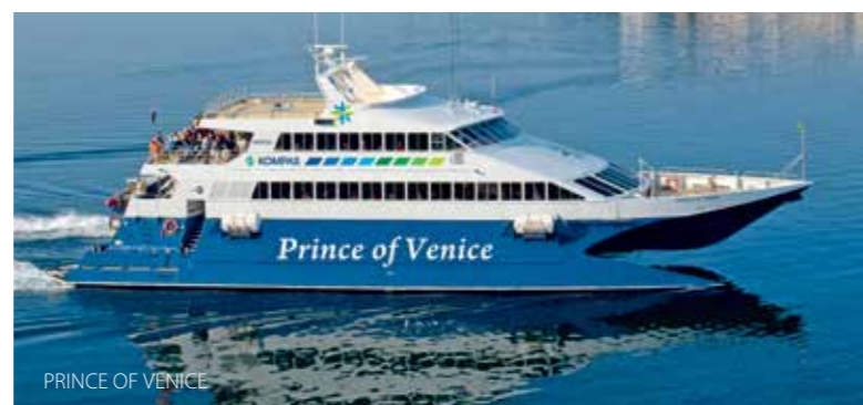
PRINCE OF VENICE

ore 17.00 partenza da Venezia imbarco dalla Stazione Marittima di San Basilio ore 07.30 partenza dall'Istria imbarco dai porti principali di ogni singola città