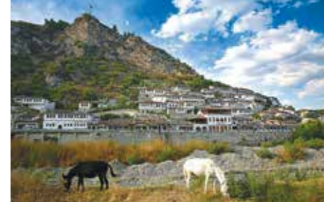
Albania – Berat