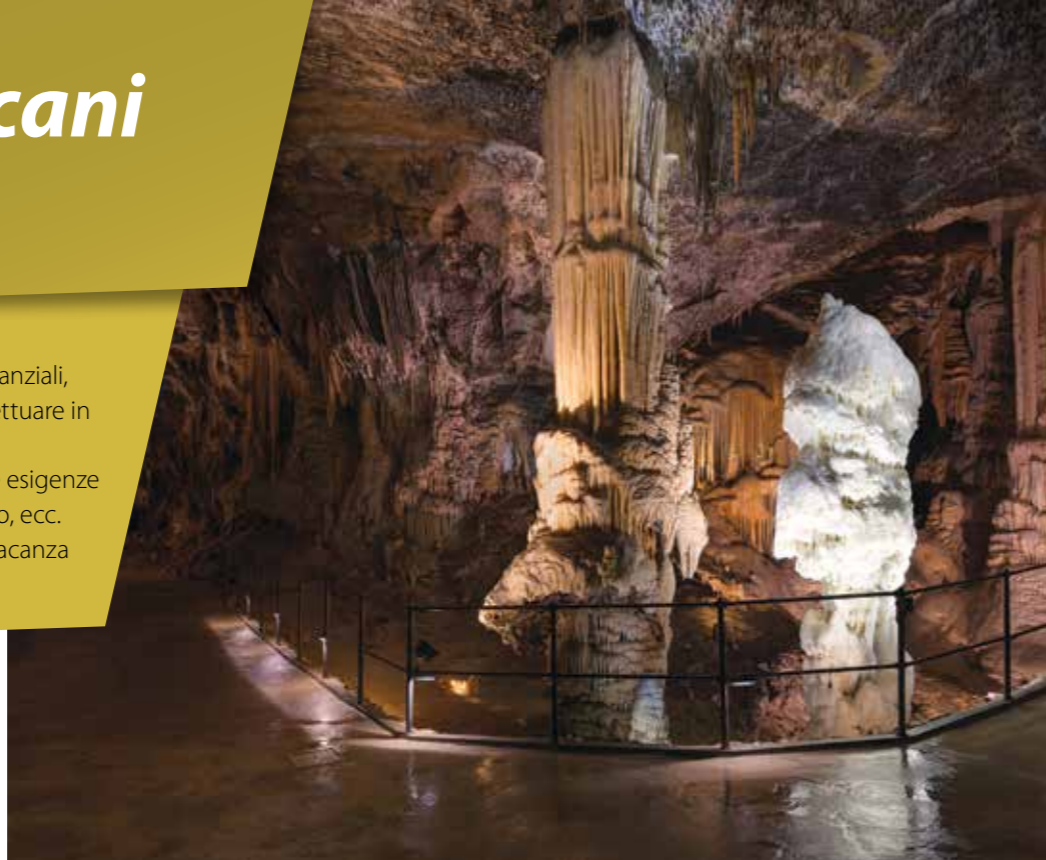
Slovenia – Grotte di Postumia; Photo: Iztok Medja