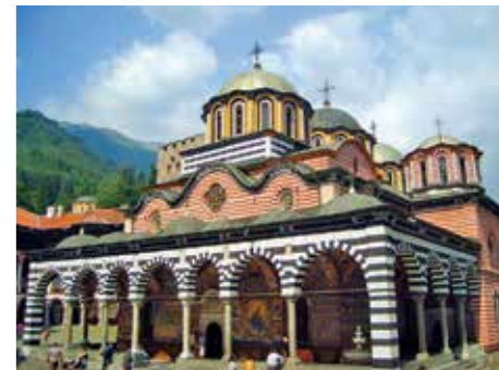
Bulgaria – Monastero di Rila

Prima colazione in hotel. Tempo a disposizione e trasferimento in aeroporto per il rientro in Italia. Fine dei nostri servizi.