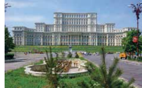
Romania – Bucarest