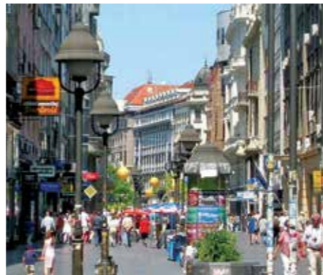
Serbia – Belgrado