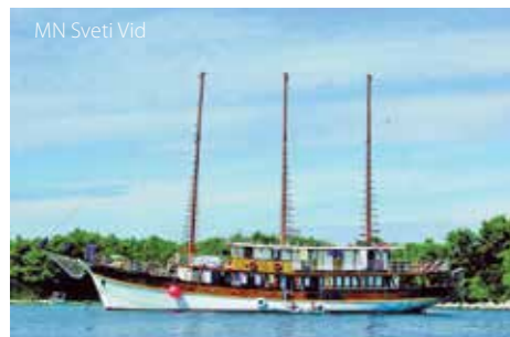
MN Sveti Vid