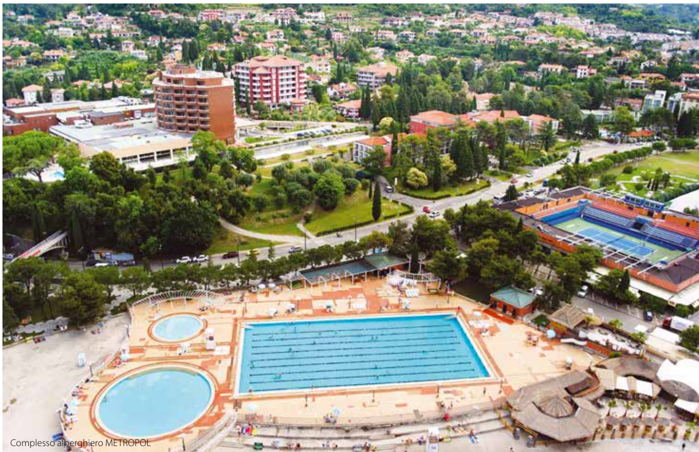
Complesso alberghiero METROPOL