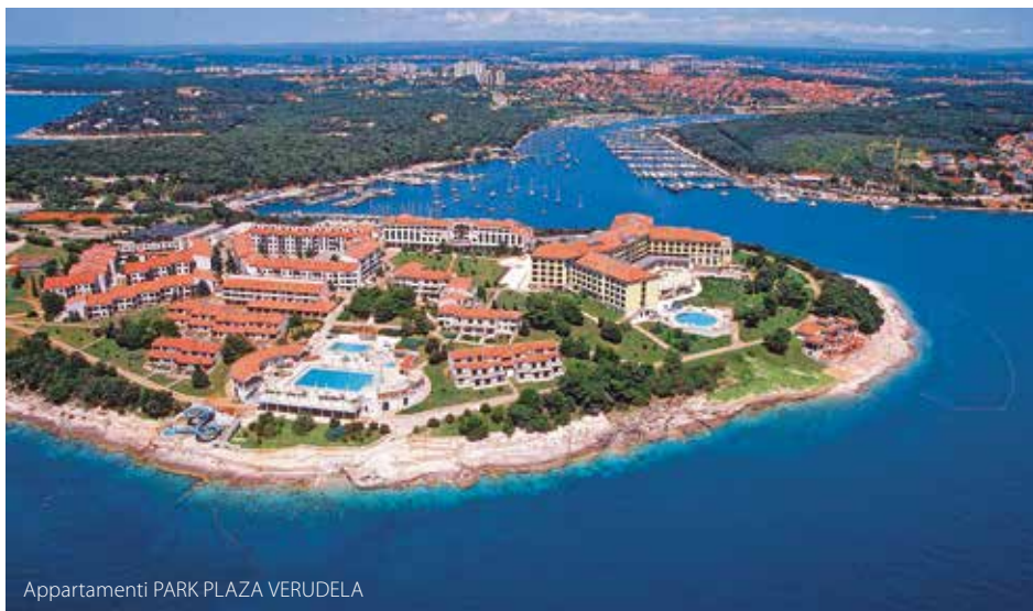
Appartamenti PARK PLAZA VERUDELA