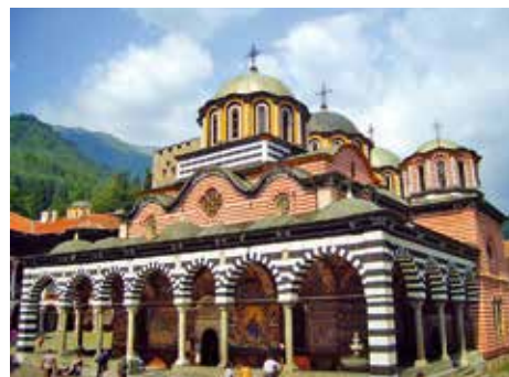
Bulgaria – Monastero di Rila

Prima colazione in hotel. Tempo a disposizione e trasferimento in aeroporto per il rientro in Italia. Fine dei nostri servizi.