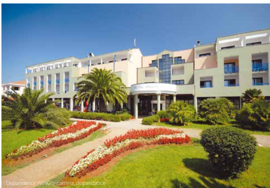
Depandance WING > camera, depandance