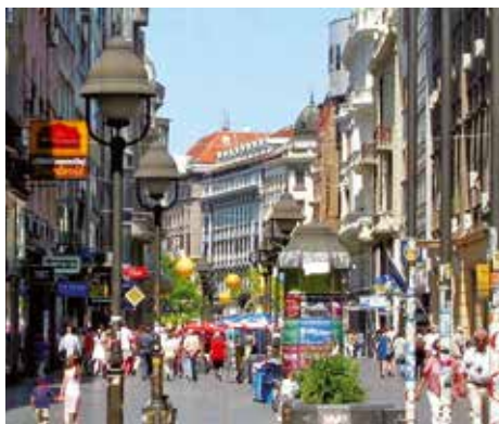
Serbia – Belgrado