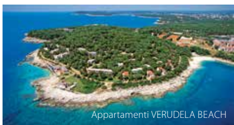
Appartamenti VERUDELA BEACH