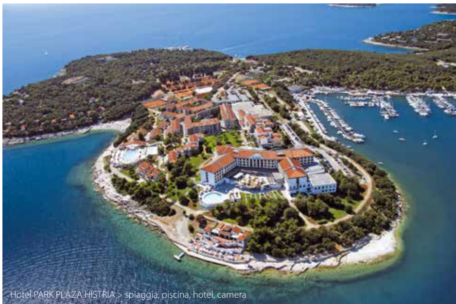
Hotel PARK PLAZA HISTRIA > spiaggia, piscina, hotel, camera