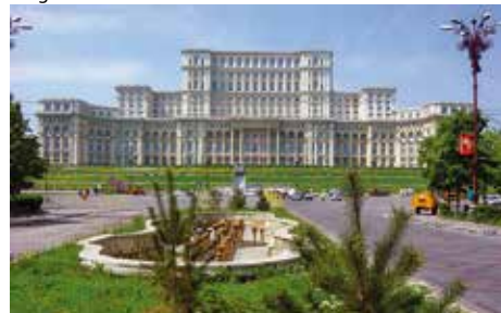
Romania – Bucarest