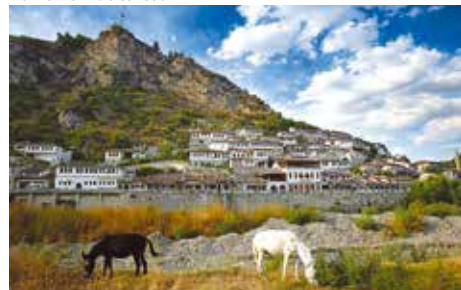
Albania – Berat